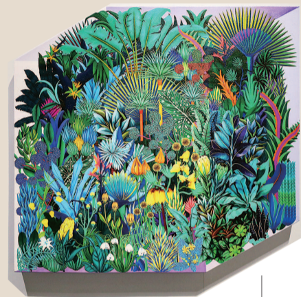
■ 郭恒作品 《禁乐园》