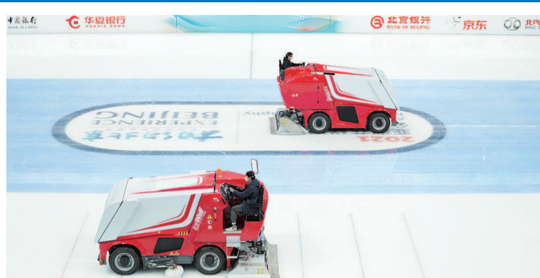
■ 首都体育馆工作人员修整冰面