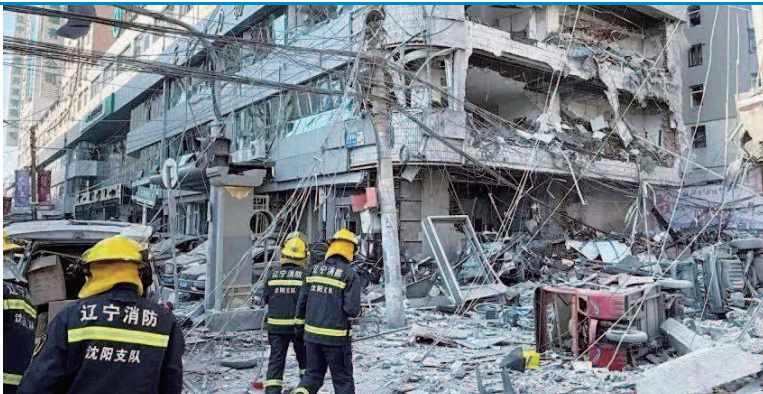
消防救援人员正在现场处置

动干预研究和真实世界研究的最新成果,明确提出每天保证日间户外活动120分钟,分别落实在校内和校外,充分发挥课间10分钟、上下午各增加30分钟大课间、结伴同行上学(“健康校车”)等模式在近视防控中的积极作用。 据新华社