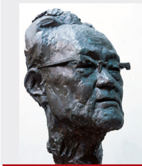
▲ 唐世储,《不说假话——向晚年巴金致敬》,青铜,一九九四年 ▲ 唐世储,《平民教育家陶行知》,青铜,二〇〇九年,上海中华艺术宫收藏