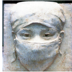
典而作,上海历史博物馆收藏 玻璃钢,二〇〇三年,为纪念全民抗非 唐世储,《记住那双美丽的眼睛》