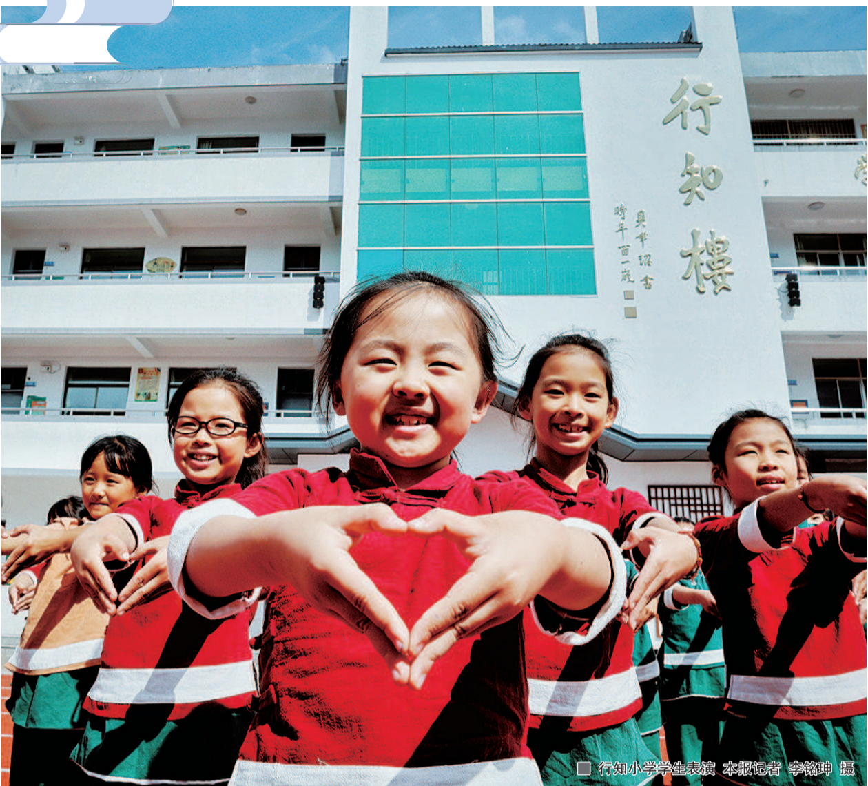
行知小学学生表演