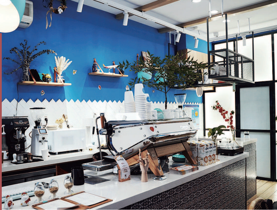
▲ OZ café 店景 ▶ Pushing 门头