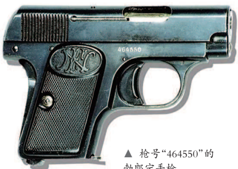
▲ 枪号“464550”的勃朗宁手枪

此四寸“第四六四五〇号”小勃朗宁手枪，系本党总理孙先生亲自衣袋中取出授余者。缘陈英士先生于上海萨坡赛路（今淡水路）十四号寓内遇刺……总理闻耗惊问伤势如何，余言：有弹贯入额头及颊内，不可救矣。总理黯然。有间，即被衣，言自往视英士。有同志力阻，总理言：英士为党国死，吾岂可不往视？遂以此枪授余，令相从行事。后余将缴还，总理言：即以付汝，长作纪念，共毋相忘英士之殉党国也。