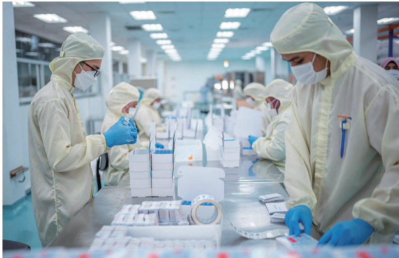
马来西亚工人在包装本地灌装生产的中国科兴疫苗

造成增长分化的主要原因是疫苗获取能力和政策支持力度存在巨大差异。目前发达经济体中已有近60%人口完全接种疫苗,低