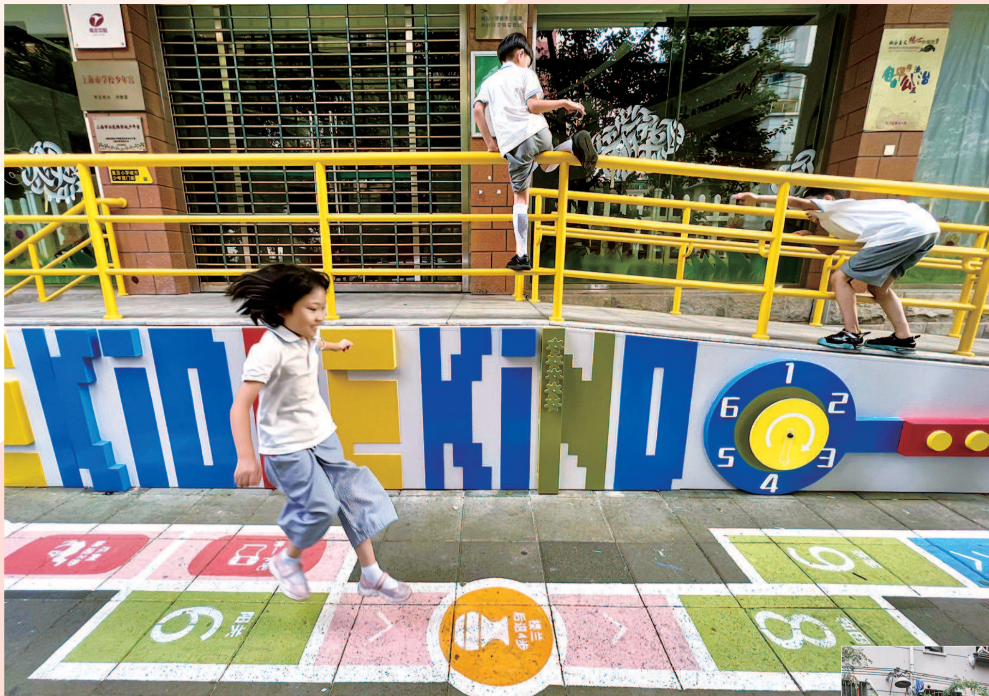
新华社区以“美好新华”作为策展主题,将社区作为沉浸式展场。法华镇路上,以“玩乐间”为主题的体验项目让放学路上的孩子欢快地玩起来

在焕新的社区与家人朋友漫步、休憩,通过城市空间艺术季营造的美好氛围和一系列活动,来一场与新邻的相遇,是2021上海城市空间艺术季展现的一种年轻、时尚、艺术的社区生活方式,也使“15分钟社区生活圈”的种子在城市的每个角落生根发芽。