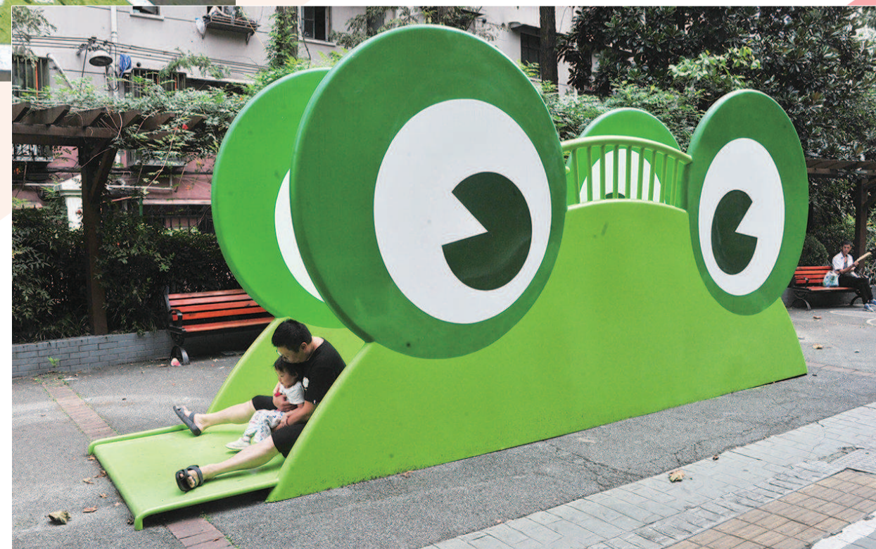
市民漫步在杨浦区四平街,每走过一段路,都能与一个艺术空间“邂逅”,设计师通过抽象化的创意,让休憩和游戏功能融为一体。抚顺路上的青蛙和熊猫头像既是可爱的卡通形象又是滑梯,这一全新的“动物游乐园”每天都吸引居民带着孩子前来玩耍