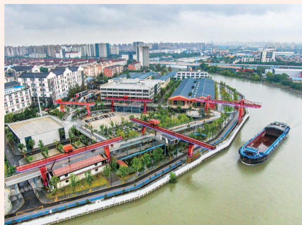
老码头改造的1号湾园区成为市民休闲好去处