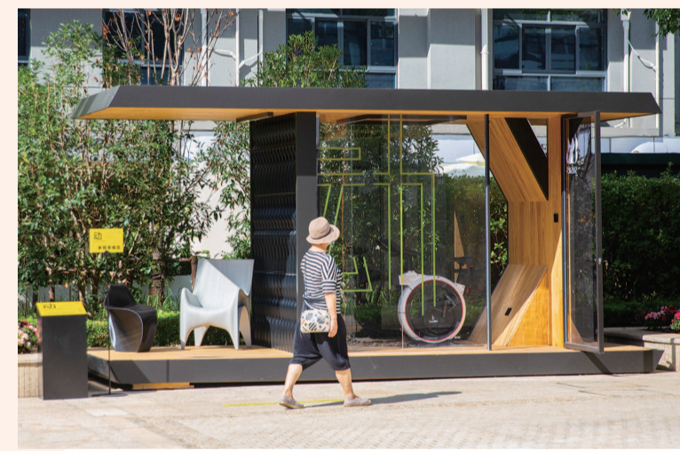
长宁区的社区盒子带给市民沉浸式的交互体验,成为城市15分钟生活圈中的活动载体