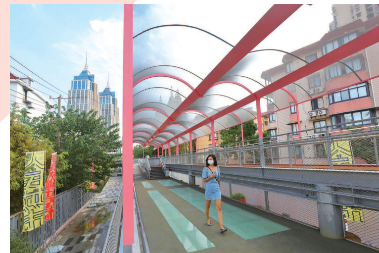
普陀区曹杨新村街道的百禧公园是一座由铁路轨道、高架桥等改造而成的高线公园