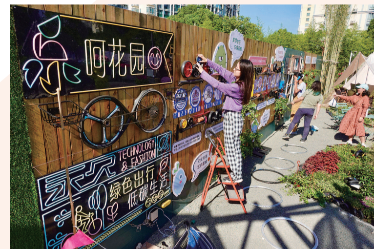
徐汇区原钦州路花鸟市场变身以“花开蒲汇塘”为主题的都市空间艺术创作主场