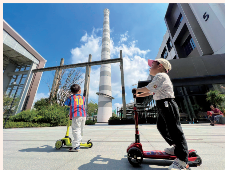
闵行区益梅路91号力波啤酒厂的老厂房经过重新改造,以“力波1987”创意园区重新亮相