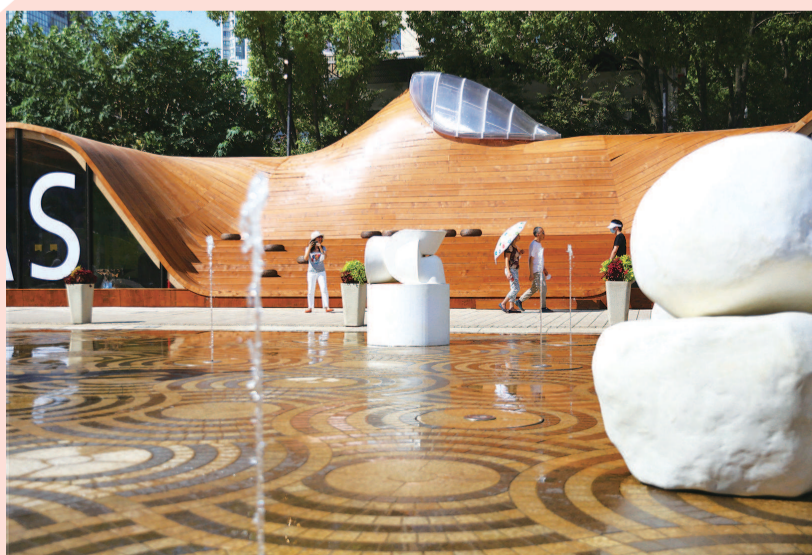
城市空间艺术季在上生新所启幕。主馆“共”为一个数字木构工艺的拓扑曲面建筑。前面为喷泉广场,广场上布置有一组艺术品《社石》