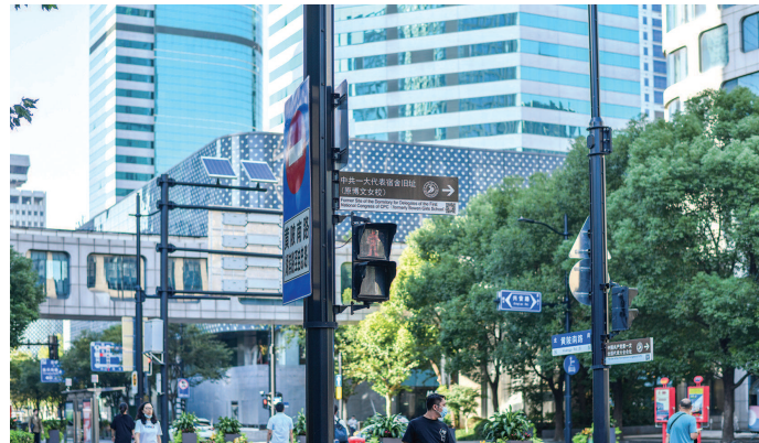
■ 新建的综合杆干净又整齐