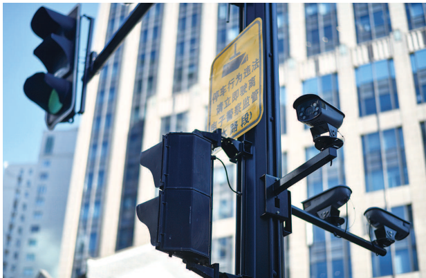
■ 原来分散的各类杆件设施全部整合到新建的综合杆上