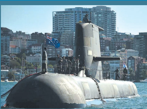
▲ 澳大利亚目前的潜艇舰队 图 GJ ► 拜登(中)、约翰逊(右)与莫里森举行网络会议

统一的支持人选，选票争夺战势必激烈。 目前，河野太郎在民意调查中人气最高，获得有较强基层优势的前干事长石破茂、环境大臣小泉进次郎、自民党国会对策委员长森山裕支持。河野隶属副首相麻生太郎领导的“麻生派”，但未获派系全员支持。首相菅义伟先前表态支持河野。 岸田文雄领导的“岸田派”议员有40多人，他获得前经济再生担当大臣甘利明支持。高市早苗政策主张保守，获得党内最大派系“细田派”部分议员和保守团体支持。有媒体先前报道，前首相安倍晋三支持高市。 野田圣子不属于自民党内任何派系，党内基础相对薄弱。