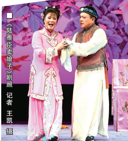
《陆雅臣卖娘子》剧照