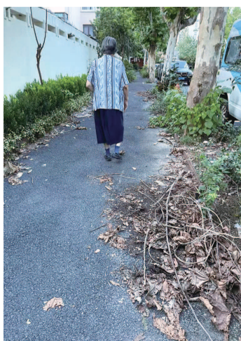
■ 彰武路上枯叶、杂草无人清理