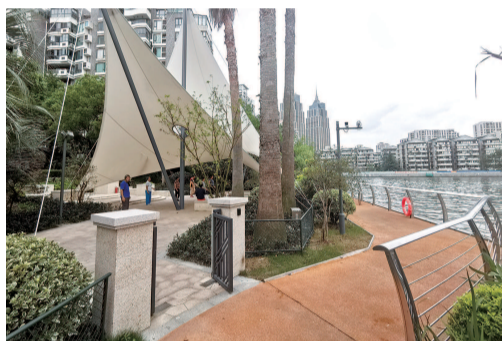
■ 小区广场成了对外开放的广场舞公共场地