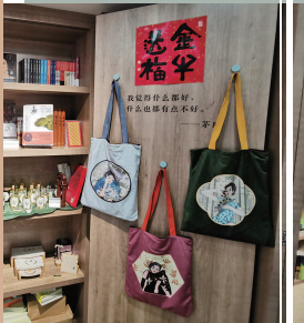
■ 公啡书社里的文创产品