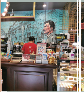
■ 公啡咖啡馆吧台及鲁迅墙绘