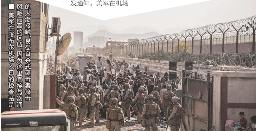
风险最高的区域, 因为这里直接与汹涌的人潮接触, 易受自杀式袭击者攻击 美军在喀布尔机场入口的检查站是