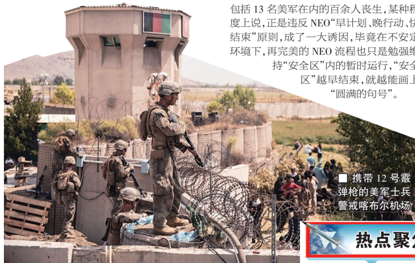
携带 12 号霰弹枪的美军士兵警戒喀布尔机场

由于美机天天起降喀布尔机场, “不要证件也能走”的流言遍传阿富汗民间, 导致很多人来碰运气, 而美军仍坚持“美国人、持绿卡或有效签证持有者、安全受威胁者”的准入标准, 结果在机场外造成大量聚集, 令极端组织“伊斯兰国”在 26 日袭击得手, 包括 13 名美军在内的百余人丧生, 某种程度上说, 正是违反 NEO“早计划、晚行动、快结束”原则, 成了一大诱因, 毕竟在不安定环境下, 再完美的 NEO 流程也只是勉强维持“安全区”内的暂时运行, “安全区”越早结束, 就越能画上“圆满的句号”。