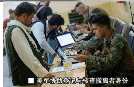
美军协助登记与核查撤离者身份

从 8 月 17 日下午起, 喀布尔机场重新开放, 许多经典的 NEO 场景豁然呈现。在机场外围, 美军同塔利班指挥官天天沟通, 确保互不敌对。美军还以“带你们一起走”为条件, 说服 500 多名阿军残部站完最后一班岗。为了缩小任务范围, 美军只开放 3 个机场入口, 陆战队员按照人群控制流程, 组成防暴盾牌阵, 配备催泪弹、闪光弹和霰弹枪, 只让符合条件的人进来。当人群进了大门, 就碰到撤离控制中心(ECC), 这类似机场值机柜台和安检区, 由陆战队员分批放行, 翻译讲解流程, 人员和包裹分开检查, 尤其美国女兵负责女性安检。随后, 是 5 到 6 名陆战队员对被撤离人员进行电脑录入登记, 美国海关、移民局、国土安全部、使馆等部门对人员进行身份和资格核查, 通过者在陆战队引导下进入不同等候区。要强调的是, 广义的 NEO, 不仅包括撤离战地, 后续还有中转站分流、本土临时安