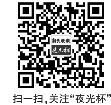
扫一扫，关注“夜光杯”

等到他的自学定力铸化磐石，我会诱导他还原游戏学习，比如《瘟疫公司》，比如《欧陆风云》，都让你沉浸其中担当角色，游戏的沉浸式学习，效率高高于文字，尤其吸收与运用混合，这是书面文字做不到的，起码不会成为书呆子。互联网时代，游戏是益智玩具，也是堕落诱饵。教育之难，难在何处