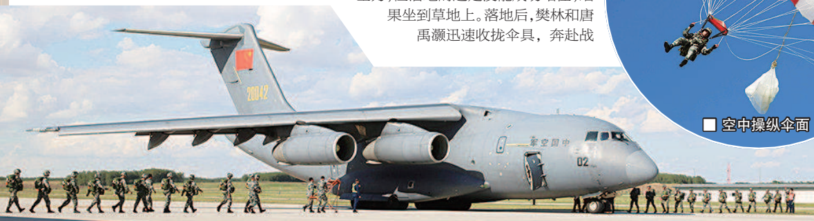
■ 特战官兵鱼贯登上大飞机