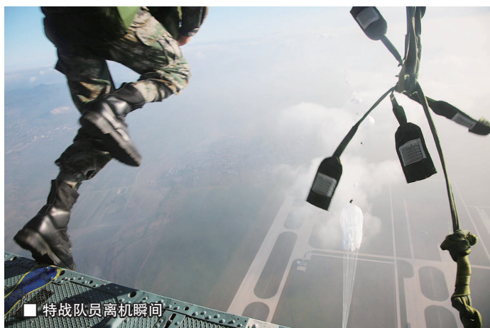
■ 特战队员离机瞬间