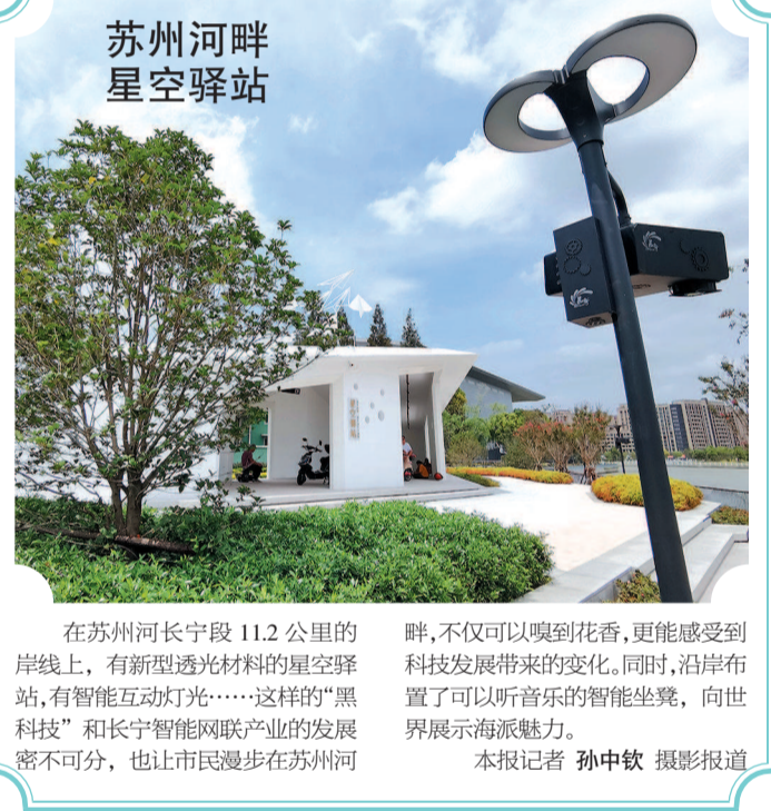
苏州河畔 星空驿站

在苏州河长宁段11.2公里的岸线上,有新型透光材料的星空驿站,有智能互动灯光……这样的“黑科技”和长宁智能网联产业的发展密不可分,也让市民漫步在苏州河