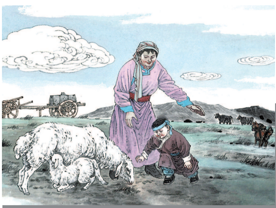
7 在母亲的呵护下，孩子蹒跚学步，迈出人生第一步。