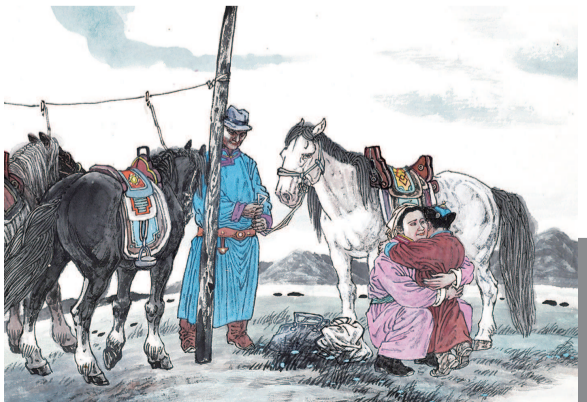
16 长大的孩子有了新家，每次离别都有骨肉分离之痛。