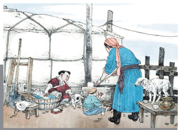
9 幸福童年像阳光下的肥皂泡般七彩斑斓。