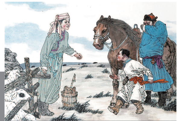
18 小骏马跑回额吉身旁，孩子的心牵挂着母亲。