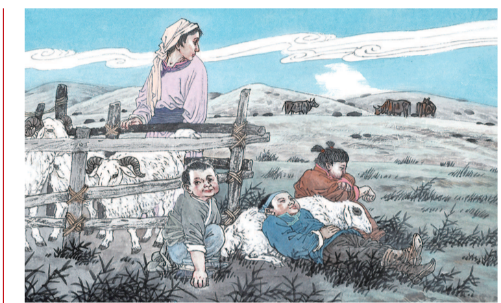
10 草原微风吹散阴云，风中传来青草的芬芳和百灵鸟的欢快歌声。