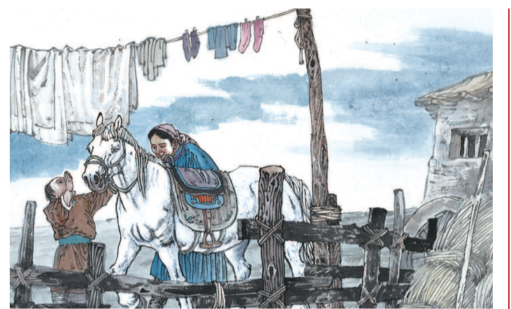
13 是雄鹰就该翱翔苍穹，是骏马就该驰骋草原。