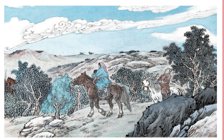
14 跨马扬鞭，踏遍山岭，才能长成健壮的牧人。