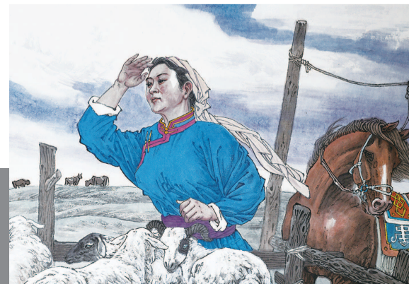
17 眺望着远去的背影，思念的泪水在风中流淌。