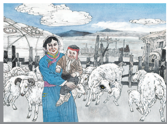
8 温暖春风将羔羊跪乳的感恩吹进幼小的心灵。