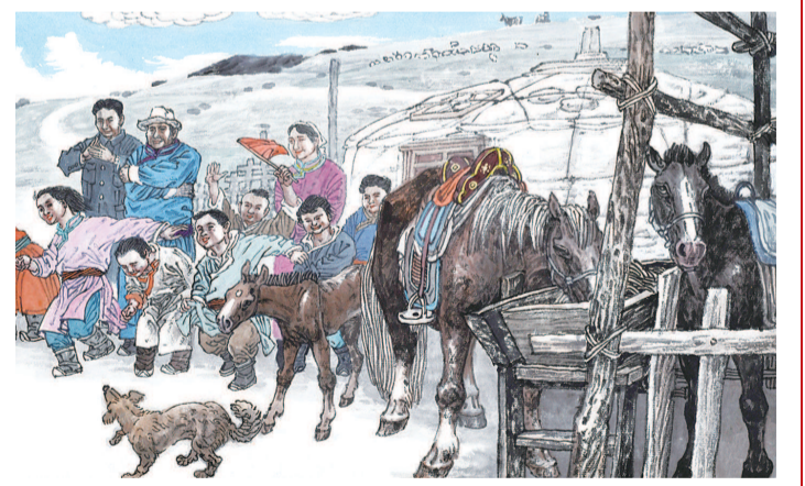
15 亲情关怀的滋润下，瘦弱的孩子已壮如马驹。