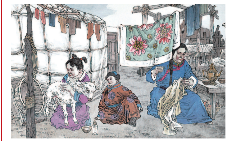
11 一针一线凝结慈母千般柔情，身上衣袍织进万种叮咛。