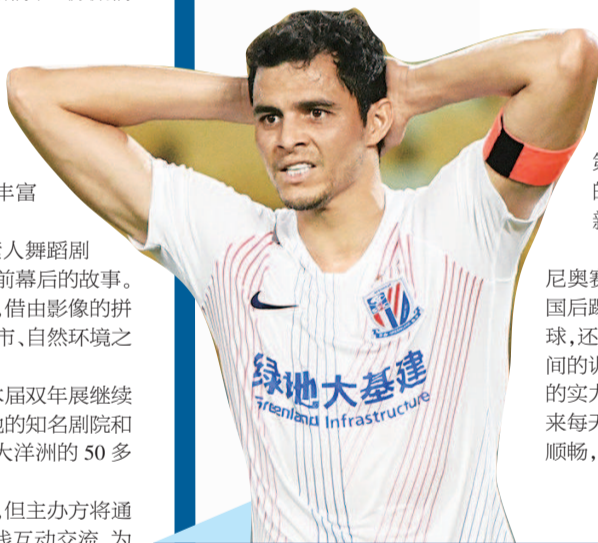
■ 申队长莫雷诺很失望