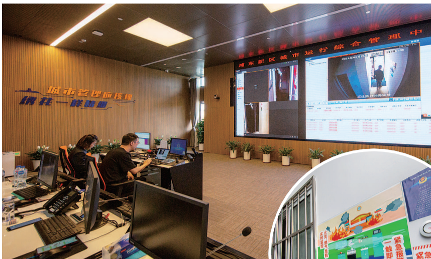
▲ 通过张江镇城运中心，实时关注租赁住房安全情况 ▶ 张江镇环东中心村正在试点安防三件套

体专门开发了“安居张江”小程序，其功能涵盖了租赁住房管理日常所需，如：房源查询、合同管理、租客管理、收入记账等。通过引导二房东对小程序的日常使用，同步实现出租房、租客等信息的云端更新。