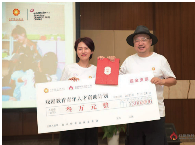
徐峥(右)发布“戏剧教育人才资助计划”

故事、文学经典、生命美学等多个议题的戏剧教育导师工作坊。夏令营还特别邀请了创意达人詹昊宸,讲授一堂火种大师课,带来了他原