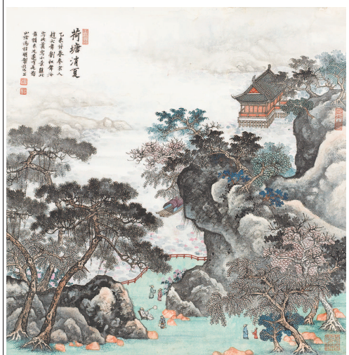
荷塘消夏(中国画) 汤哲明