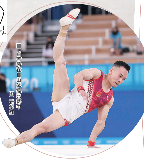
肖若腾在自由体操比赛中

昨晚的自由操决赛,在与以色列、俄罗斯、韩国、西班牙等选手的激烈争夺中,肖若腾诠释了什么是最棒的参赛者。如果没有里约奥运会前的意外重伤,没有整整半年时间从阴霾走出,没有对体操运动由衷的热爱,昨晚你就不会看