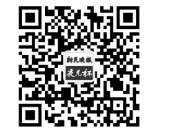
扫一扫，关注“夜光杯”

中国武术影响着世界，诸多国家的拳术都受到中国功夫的影响。2002年，喜爱中国功夫的俄罗斯