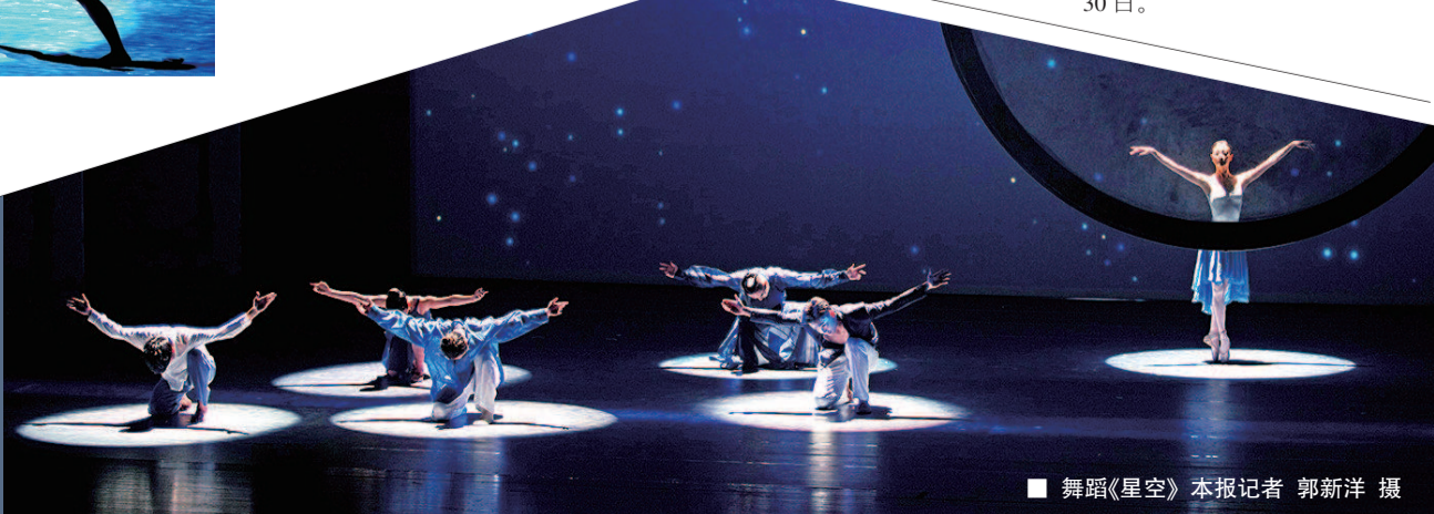
■ 舞蹈《星空》