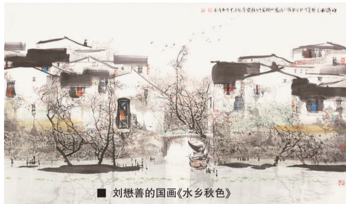
■ 刘懋善的国画《水乡秋色》

展览由上海浦东新区高东镇人民政府、上海浦东新区美术家协会、上海碧云美术馆联合主办。