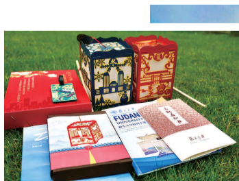
■ 复旦大学录取通知书“大礼包”

作为入学的第一份礼物，这些在设计上别出心裁又合情得宜的“新生邀请函”，饱含期许与愿景，将成为今年高校新人开启人生