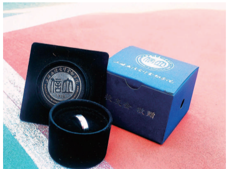
■ 戒指 上海立信会计金融学院毕业伴手礼

一些高校在设计上采用实用设计理念。比如，上海理工大学为本科优秀毕业生们准备的是一款精致工具箱，堪称“理工气质满满”，上面印着中文校名和英语缩写，以及校训，配以上海理工大学标志性的红