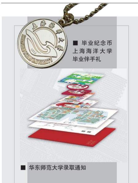
■ 毕业纪念币 上海海洋大学 毕业伴手礼