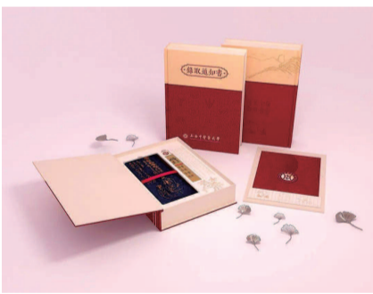
■ 上海中医药大学录取通知书礼盒