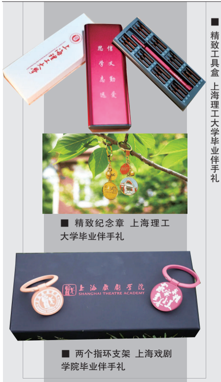
■ 精致工具箱 上海理工大学毕业伴手礼