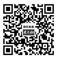
扫一扫,关注“夜光杯”

海的高速发展。22年来,我们的业务规模从最初的4亿元增加到2020年的百亿元,上海经济建设高速腾飞!22年来,通过政府采购节约财政资金近60亿元,节约的钱可以新建7.3座南浦大桥,“人民城市为人民”的理念落地发芽,开花结果!22年来,我们从主要采购通用办公设备,发展到现在拥有信息技术服务、城市规划和设计等47个项目,政府治理能力不断提升,治理体系越来越现代化!我的岗位就像一颗小小的螺丝钉——朴实、不起眼,但牢固、值得信赖。 而今,我站立在洋山深水港码头向远方眺望,看见旭日东升的海上,上海这艘“巨轮”正鸣笛启航,满载希望,向着星辰大海劈波斩浪,不断前进! 十日谈 明日请看一篇《向阳而生 后勤保障你我他 光而行》。 责编:徐婉青