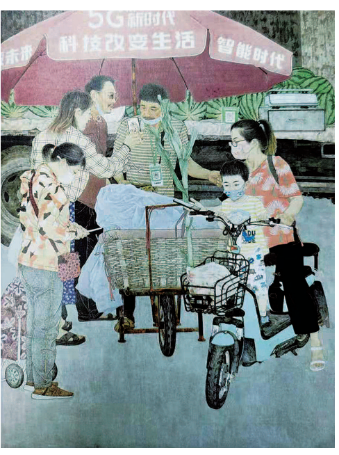
智享新生活 (中国画) 王琨