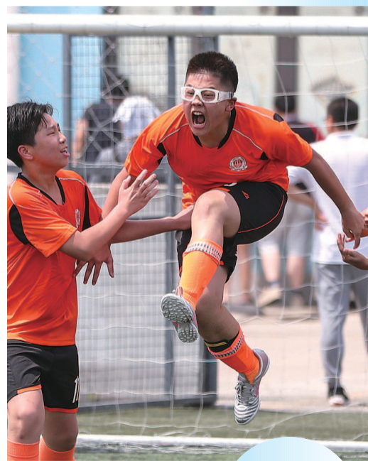
■ 进球了,“眼镜侠”欣喜若狂

每次终场哨响,赛场内总是有人欢喜有人愁,那一刻,刚才还紧张到恨不能自己上场的教练员,都会露出柔和的一面:赢家笑着击掌拥抱,输家也能笑着互相摸头安慰,说一句“没关系,我们明年再来!”正如几位教练所言:“参加晚报杯,比赛输赢不是最重要的,让孩子感受足球快乐,在身体和心智上有所成