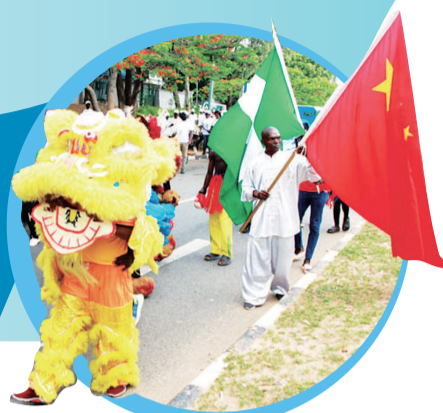
路演队伍中的中国雄狮表演让民众眼界大开

“校园”歌舞大赛上获一等奖的作品。艳丽的中国红演出服装、欢乐明快的中国音乐、柔美曼妙的东方舞姿以及悦耳动听的中文歌曲，让在场的嘉宾和观众享受到来自东方的艺术大餐。尼新闻和文化部常务秘书安颜乌塔库代表赖伊部长讲话，特别感谢中国驻尼使馆给予此次“世界文化日”活动的大力支持。