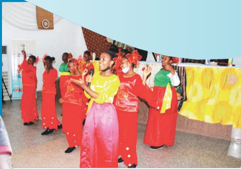
加奇中学“中国之角”学生们演绎中国歌舞