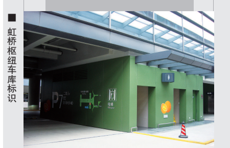
■ 虹桥枢纽车库标识