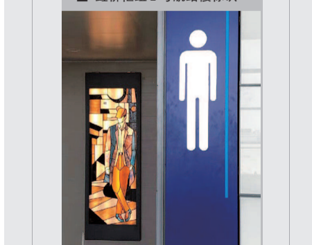
■ 浦东国际机场卫星厅彩绘玻璃男-预防低头族厕所识别强化