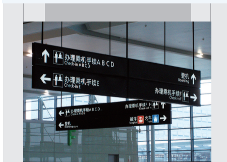
■ 虹桥枢纽2号航站楼标识