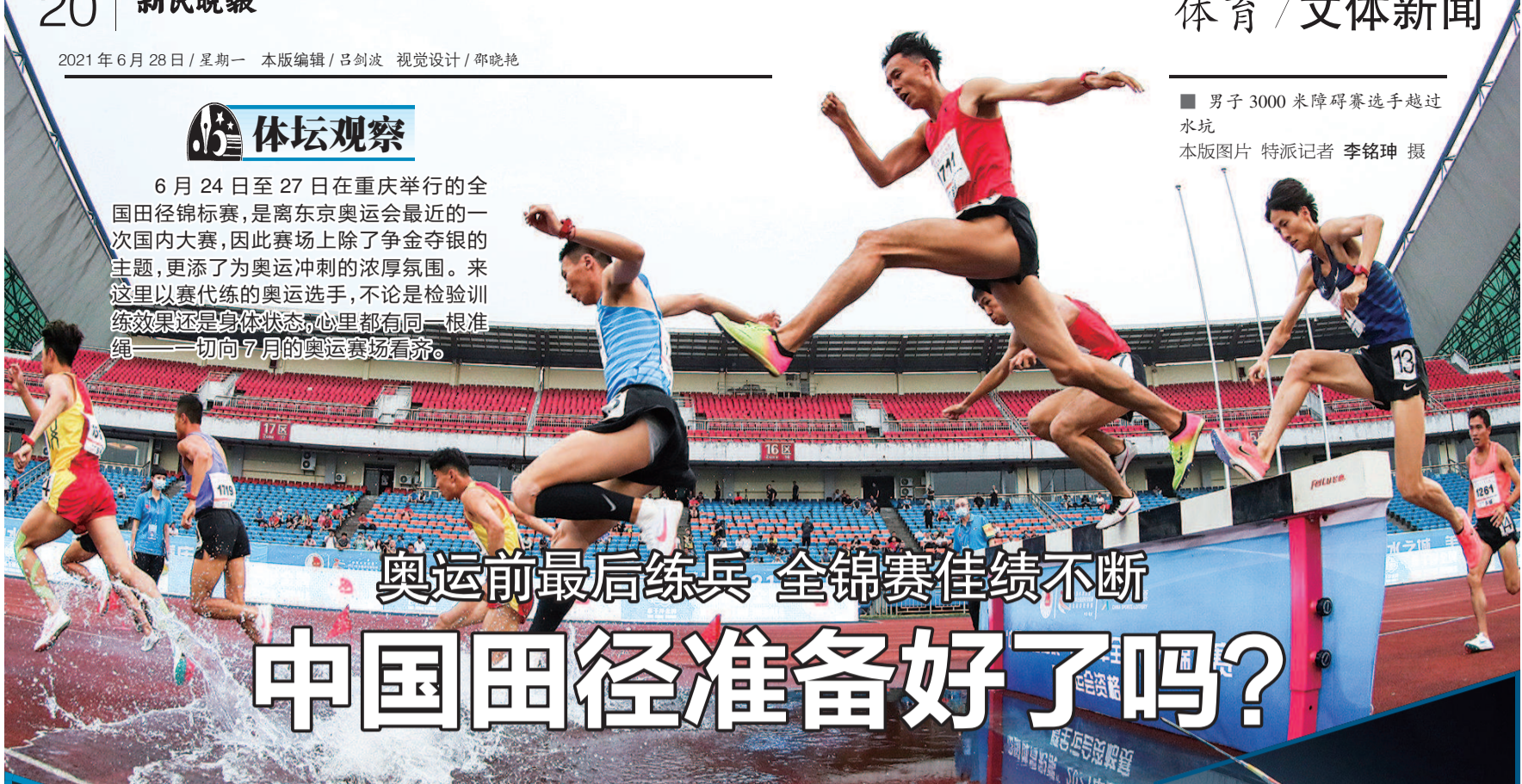
男子3000米障碍赛选手越过水坑