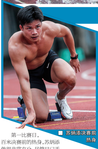
第一比赛日,苏炳添决赛前热身

百米决赛前的热身,苏炳添做得非常充分。尽管早已手握东京奥运会的人场券,但亚洲飞人一丝不苟,仿佛,两小时后在重庆奥体中心上演的,即是奥运会的百米之争。