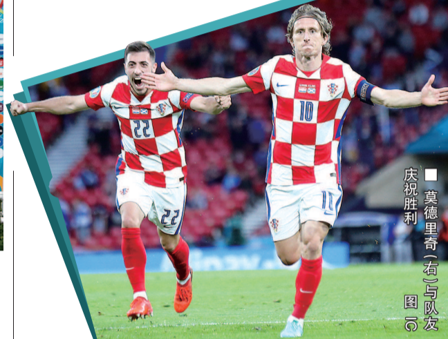
■ 莫德里奇(右)与队友庆祝胜利

如果不出意外，这会是35岁的莫德里奇最后一次代表克罗地亚队征战欧锦赛，这支享誉世界的“魔笛”不止一次表示，希望自己的欧罗巴“谢幕巡演”能够持续地更长一些。今晨的欧锦赛D组收官轮，莫德里奇用一传一射的精彩表现，带领克罗地亚队3比1击败苏格兰队，拿到淘汰赛门票后，“魔笛”的这轮演出，也得以顺利加场。