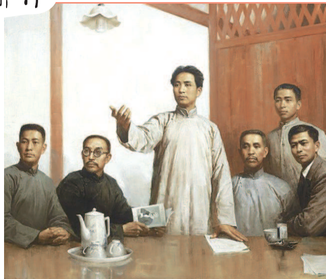
《在党的“一大”会议上》