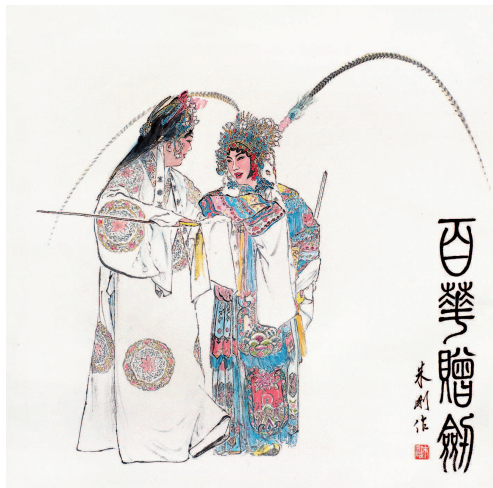
海俊醉入公主帐 百花以剑许终身 百花赠剑 (设色纸本) 朱刚

说到芹菜，想起一个问题，那就是罗宋汤的“多样性”。我曾经纠结过罗宋汤的“正宗”，也一度认为自己做得很正宗，可后来看到有人做罗宋汤不放芹菜，有人做罗宋汤放红肠之类，便开始疑惑起来。吃了大半辈子，做了几十年的罗宋汤，到底应该怎么做？想来想去，终于释然了。无需讲究所谓正宗，无需强调腔调如何，存在就是对。如同我买不到芹菜，用芹菜籽代替；如同我在物质匮乏的年代，买不到牛肉，就用猪肉替代。想到一个词“宽容”。当初，若没有红菜汤的宽容，就不会有罗宋汤，而罗宋汤不