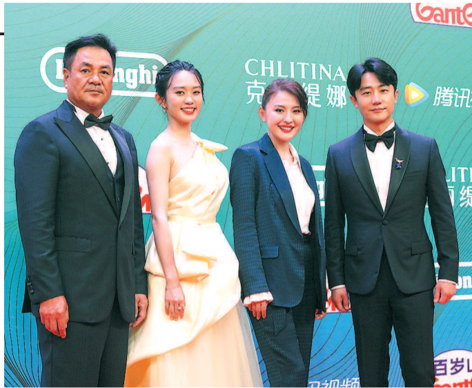
《山海情》剧组亮相