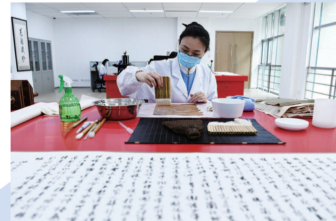
档案古籍修复技艺展示