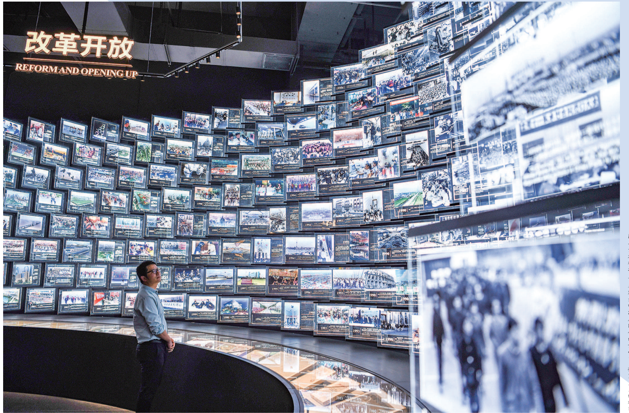
改革开放板块里,参观者畅游在时代的记忆中,探究岁月的秘密

在展厅中,观众们还可以见到许多时代感十足的“初代网红”。瞧,“上海一家人”实景屋中的许多物件,年轻人恐怕已经叫不出名字:“二八大杠”“红白机”“麦乳精”……这些消逝在岁月中的词汇,是上海改革开放、步入新时代征程的缩影,而由每年精选出一张代表照片组成的时光墙,更是让每个人都能找到属于自己的珍贵记忆,在怀旧的感慨中更加奋进。