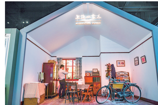
“上海一家人”展现了老上海人家的“四大件”:自行车、缝纫机、手表和收音机