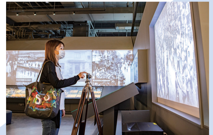
按下老相机的快门,一张张珍贵的历史照片就会浮现在眼前