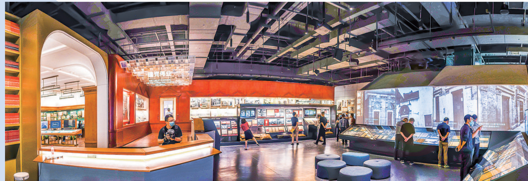
“城市记忆 时光珍藏”主题常设展精选出千件珍贵文献影像资料和实物,铺陈出百年历史沧桑