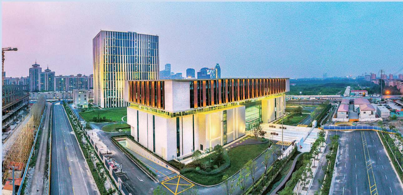
上海档案馆新馆外景