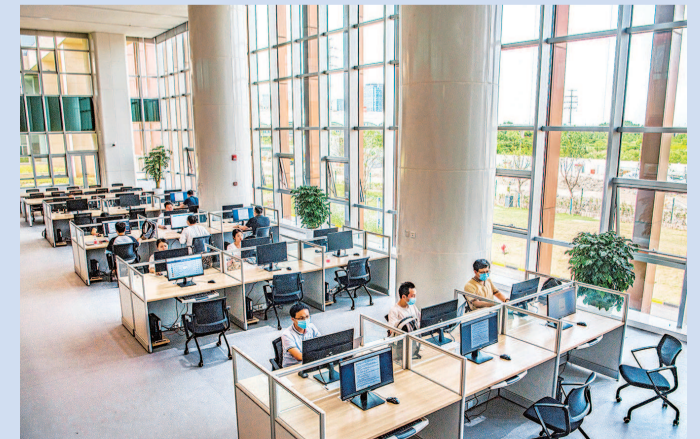
二楼公共查阅大厅内,市民可以查档和阅览编研史料