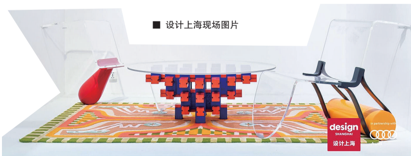
设计上海现场图片