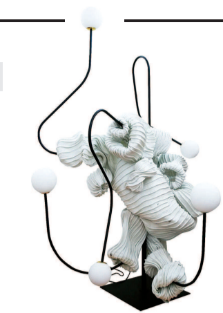
新生代设计师 宣琦梁 作品《大·世》