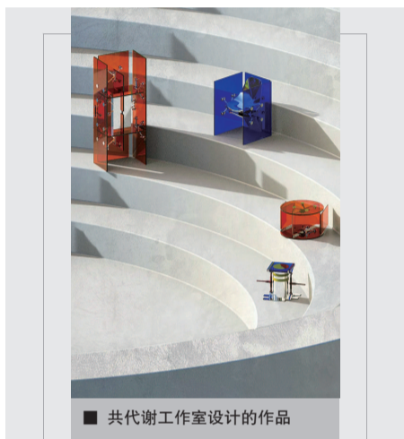
共代谢工作室设计的作品