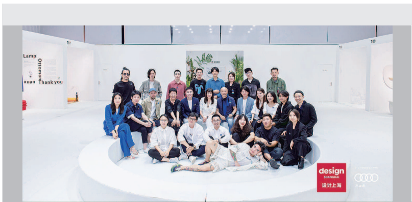
设计上海现场图片