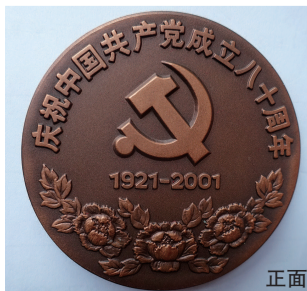
上海造币厂设计制作的《庆祝中国共产党成立八十周年》大铜章

其一为2001年，浦东新区区委宣传部与上海造币厂联合设计制作的《中国共产党成立八十周年纪念》大铜章（右上图）。这枚铜章直径60毫米，正面图案为上海兴业路上的“一大”会址，上缘环绕主题词“中国共产党成立八十周年纪念”，图案与文字让大铜章的主题一目了然。背面是浦东新区高楼林立的建筑群及“东方之光”日晷钢雕实景，彰显了改革开放的浦东新面貌，反映了浦东改革开放的巨大成就。值得一提的是，这枚纪念大铜章仅制作了380枚，尤显珍贵。