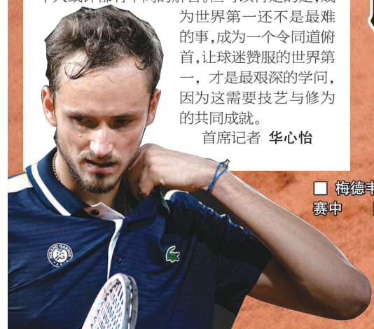
■ 梅德韦杰夫在比赛中