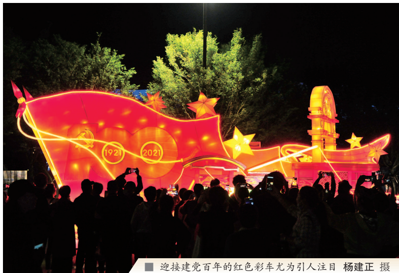
迎接建党百年的红色彩车尤为引人注目

紧接着的则是各具上海特色的花车队伍。“生态之岛·海上花岛”花车以崇明本土花卉崇明水仙这一“迎春第一花”体现“海上花岛”的生态自然,悠悠丝竹倾诉着长江入海口的传奇与浪漫。除了展现崇明魅力,上海魅力也不可少。“魅力之都·海纳百川”花车上布置了高洁无暇的玉兰