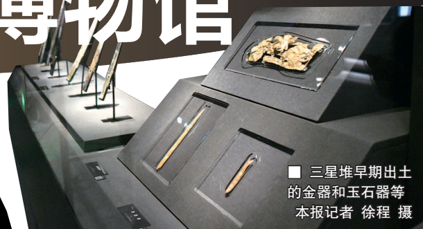
三星堆早期出土的金器和玉石器等

在真品中,也不乏稀世珍品,比如国家一级文物,商代时期的戴金面罩青铜人头像。它的大小形状面