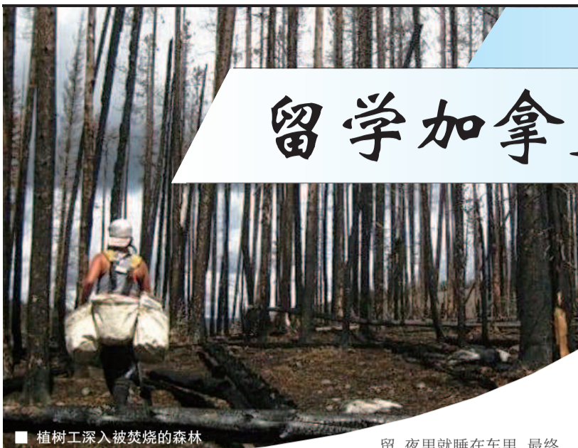
■ 植树工深入被焚烧的森林

加拿大暑期工是留学生和外国青年最受欢迎的工作之一,利用假期打一份工以支持学费,常有来自其他国家的年轻人利用这个机会游历加拿大。今年因为受疫情的影响,减少了不少暑假工机会,一些户外工种则独树一帜,成了受追捧的工作。