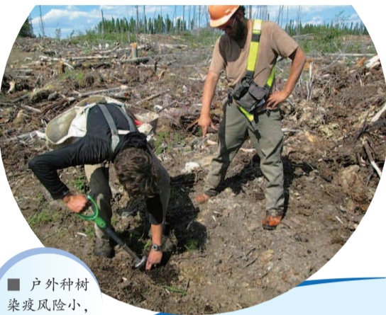
■ 户外工种染疫风险小,但工作并不轻松

此外,加拿大联邦政府还宣布,今年将通过加拿大暑期工作计划(Canada Summer Job),为15-30岁的年轻人提供带薪工作机会,目前已经发布超过15万个岗位。今年参与计划的雇主可以获得每位雇员时薪75%的补贴,非营利组织可以获得雇员工资100%的补贴。 芷语