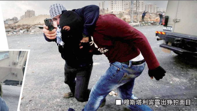
■ 穆斯塔利宾露出狰狞面目

所以在加沙等地如入无人之境,源自他们所受的严格训练。“要想当穆斯塔利宾,起码要接受 15-18 个月的特殊训练,先是国防军特种训练中心的 22 周步兵技能训练,反恐中心的 2 个月城市导航、反恐基础技能训练,接下来的 16-20 周则是专门训练,其间要像母语一样使用阿拉伯语、掌握阿拉伯人宗教习俗,还要学习用化妆、假发、衣着来