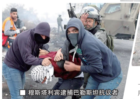
■ 穆斯塔利宾逮捕巴勒斯坦抗议者

所以在加沙等地如入无人之境,源自他们所受的严格训练。“要想当穆斯塔利宾,起码要接受 15-18 个月的特殊训练,先是国防军特种训练中心的 22 周步兵技能训练,反恐中心的 2 个月城市导航、反恐基础技能训练,接下来的 16-20 周则是专门训练,其间要像母语一样使用阿拉伯语、掌握阿拉伯人宗教习俗,还要学习用化妆、假发、衣着来