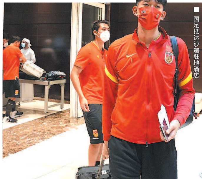
■ 国足抵达沙迦驻地酒店