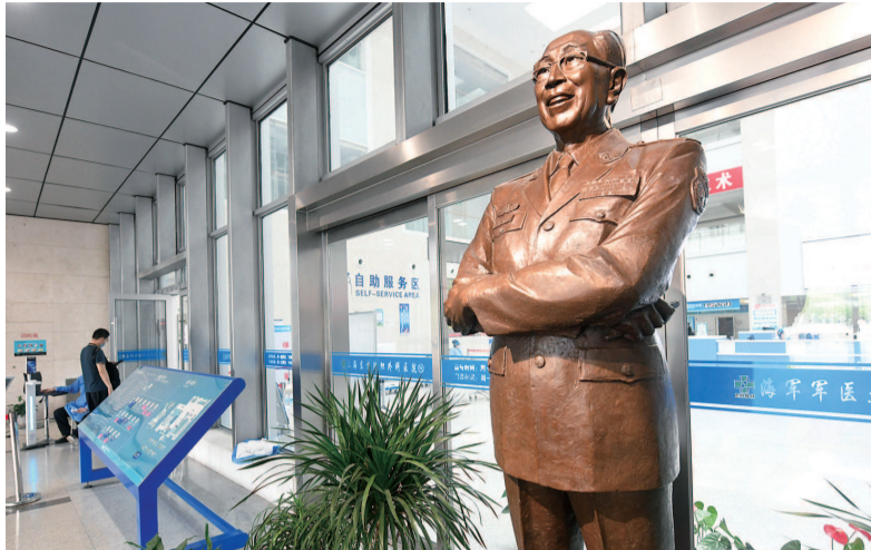
吴孟超院士的雕像竖立在上海东方肝胆外科医院安亭新院门诊大楼的大厅入口处。

从“城市”到“郊区”,很多人不理解。可吴老说,加强军民融合、主动服务上海的战略决策,是人民军医和军队医院为周边群众提供