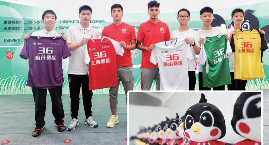
▲ 球员大使与学生代表合影 ▶ 新民吉祥物“燕小新”