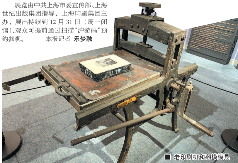
■ 老印刷机和翻模模具

展览由中共上海市委宣传部、上海世纪出版集团指导,上海印刷集团主办,展出持续到12月31日(周一闭馆),观众可提前通过扫描“沪游码”预约参观。 本报记者 乐梦融