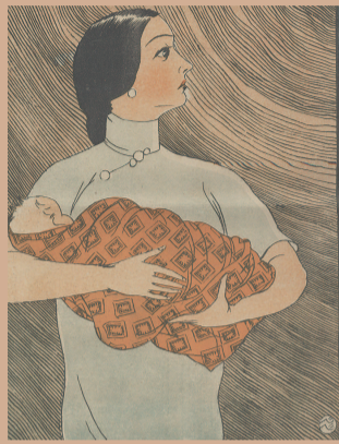
▼ 鲁少飞作品《新希望》

图书馆、博物馆、美术馆,作为城市公共文化设施,其中的馆藏也是上海文化家底的重要组成部分。盘活上海文化家底,大有可为。