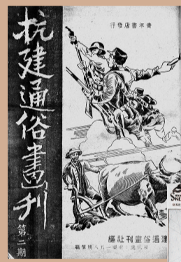
▶ 《抗战通俗画刊》第二期封面