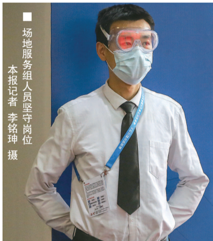
■ 场地服务组人员坚守岗位

黄强所说的，是负责内场清洁的工作人员，每场比赛开始前，他们都要换上一整套“装备”，提着扫帚和簸箕到场内工作。“跳水选手的服装特殊，一个小小的杂物，可能造成严重的伤病，所以要确保万无一失。”黄强说，每个早晨，他们都是最先和游泳池打照面的人之一，