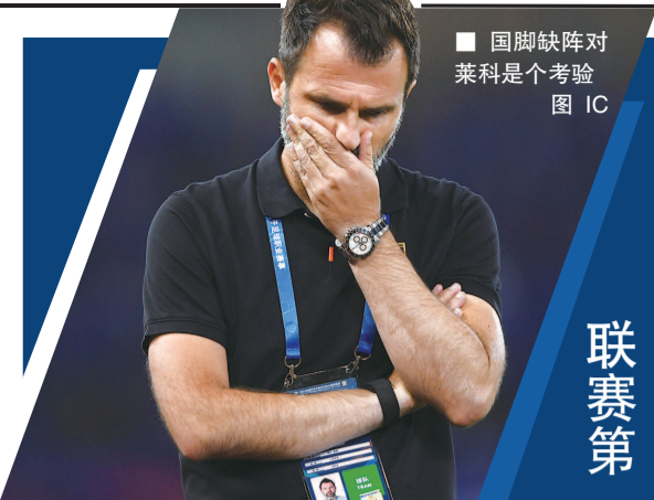
■ 国脚缺阵对莱科是个考验