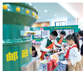
小小营业员在第一批信件上加盖日戳